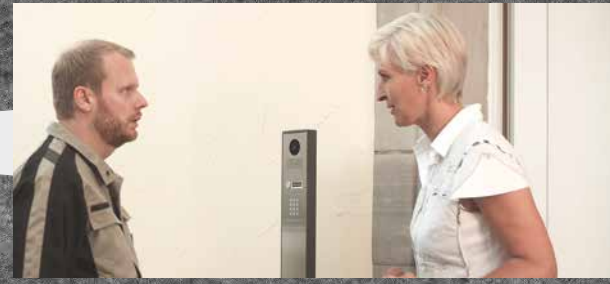
Die Empfängerin bittet ihn, die Lieferung in der Garage abzustellen.