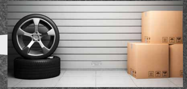
Der Paketbote kann die Lieferung in der Garage abstellen.