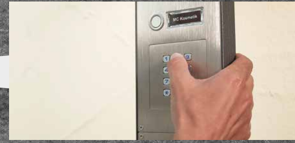
Über das Codeschloss der Türstation öffnet sie bequem das Tor.