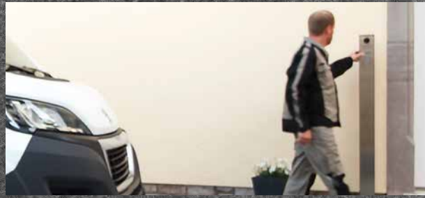
Der Paketbote möchte eine Lieferung zustellen und klingelt.